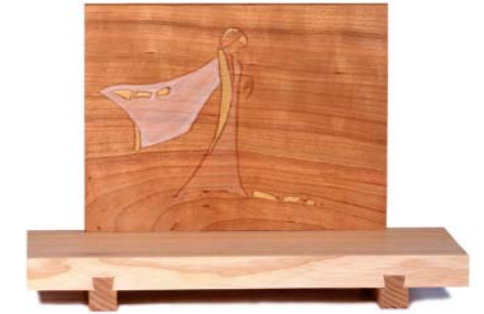
Altar „Gebet“ Eschenholz / Kirsche – Echtvergoldung Größe A · Nr. 33305