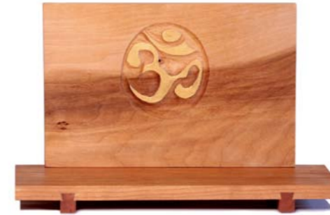
Altar „Om“ Kirschholz / Linde – Echtvergoldung Größe A · Nr. 33301

ist ein Symbol der Form, als auch des Kluges und bezeichnet die Gegenwart des Absoluten. Es gilt als das heiligste aller Mantras. OM auch AUM ist die Einheit der Dreiheit.