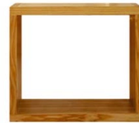
„Meditationquader“ Eschenholz Durch eine Nut und Kautschuk-Feder, können die Quader quer oder längs übereinandergestellt werden. Nr. 77701