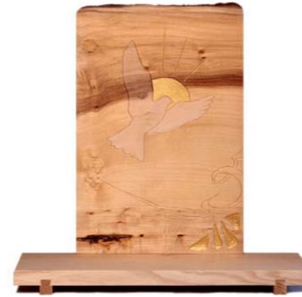
Altar „Heiliger Geist“ Eschenholz / Linde – Echtvergoldung Größe B · Nr. 33307