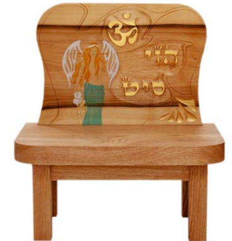
Bodenaltar „Om / Kabbalah: Einfluss der Engel, Wunder wirken“ Roteichenholz / Linde – Echtvergoldung Malerei Engel: Manou Zeise Größe C · Nr. 33303