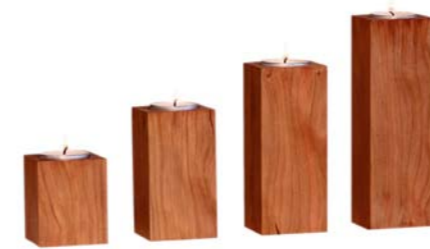
„Kerzenhalter“ Kirschholz Größe 6 cm, 9 cm, 12 cm, 15 cm Nr. 44401