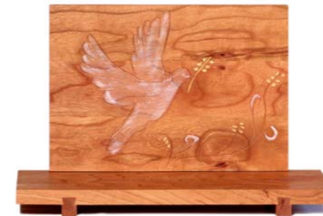
Altar „Frieden“ Kirschholz – Echtvergoldung Größe A · Nr. 33309