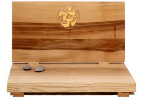
Altar „Om“ Eschenholz / Linde – Echtvergoldung Größe B · Nr. 33302