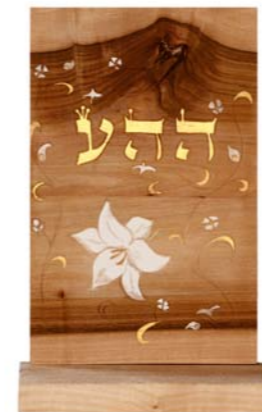
Altar „Bedingungslose Liebe“ Eschenholz / Linde – Echtvergoldung Größe B · Nr. 33313