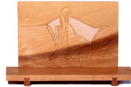
Altar „Segnung“ Kirschenholz / Linde – Echtvergoldung Größe A · Nr. 33304