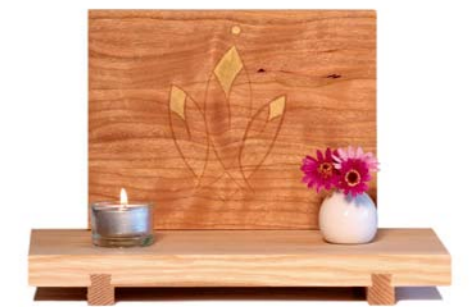
Altar „Dreifaltigkeit“ Eschenholz / Kirsche – Echtvergoldung Größe A · Nr. 33310