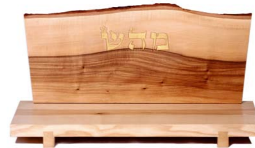
Altar „Heilen“ Eschenholz / Linde – Echtvergoldung Größe B · Nr. 33311

Es bedarf keiner Aussprache der Namen und auch keines Wissens über deren Wirkung. Sie brauchen nur von rechts nach links die Buchstaben zu betrachten (scannen), und in dieser einfachen Handlung werden spirituelle Kräfte freigesetzt.