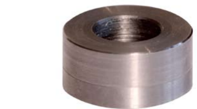
„Einsatz“ Edelstahl mit Bohrung · Nr. 44403