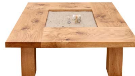
„Meditationstisch Sand“ Eichenholz - Sand Nr. 77702