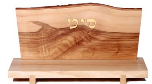
Altar „Wunder wirken“ Eschenholz / Linde – Echtvergoldung Größe B · Nr. 33314