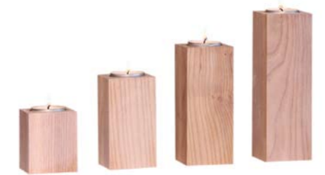
„Kerzenhalter hell“ Eschenholz weiß lasiert Größe 6 cm, 9 cm, 12 cm, 15 cm Nr. 44402