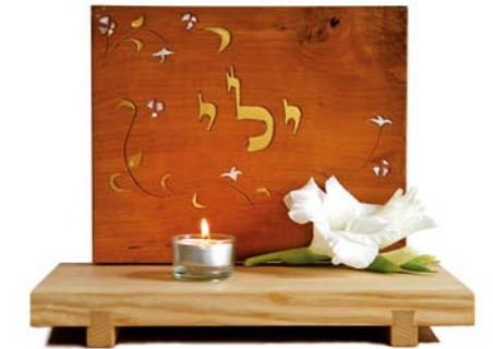
Altar „Funken Gottes zurück erobern“ Eschenholz / Birne – Echtvergoldung Größe A · Nr. 33312