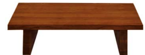
„Meditationstisch Morgenwind“ Kirschholz, Füße eingegratet Nr. 77703